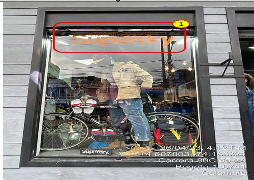
Fotografía No. 4

26/04/23, 4:12 PM +4.607803, -74.185321 Carrera 80C 65-24 Bogotá 110741 Colombia