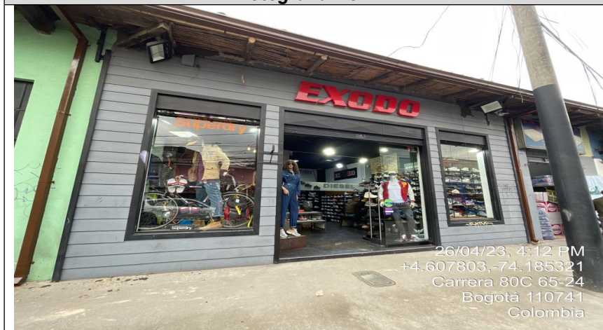
Fotografía No. 2

Nomenclatura del predio contiguo donde se encuentra ubicado el establecimiento de comercio EXODO S.A.R.